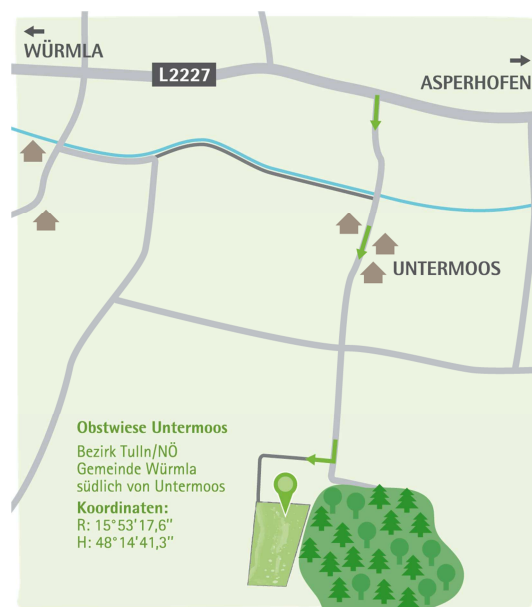
Lage der Obstsortenerhaltungswiese